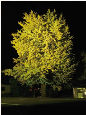
黄葉の時期には銀杏の木のライトアップも行われます。