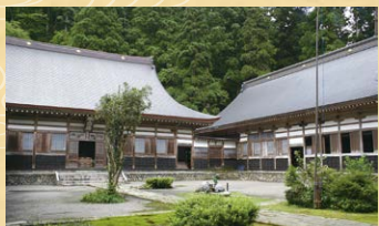
本堂(国登録有形文化財)

応永10年(1403)、楠木正成の直系・傑堂能勝禅師により中興開山された名刹。お堂や四天王像など貴重な歴史遺産と厚い信仰を残し、参拝者が絶えません。