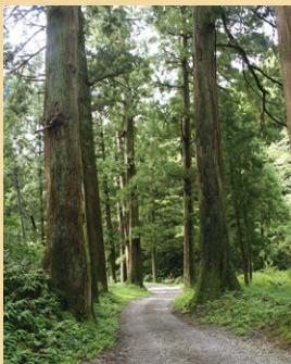
スギ並木(県指定天然記念物)