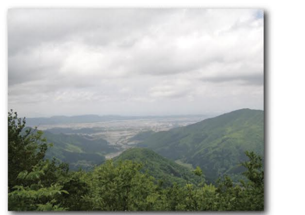
道中市街方面(権現山眺望)