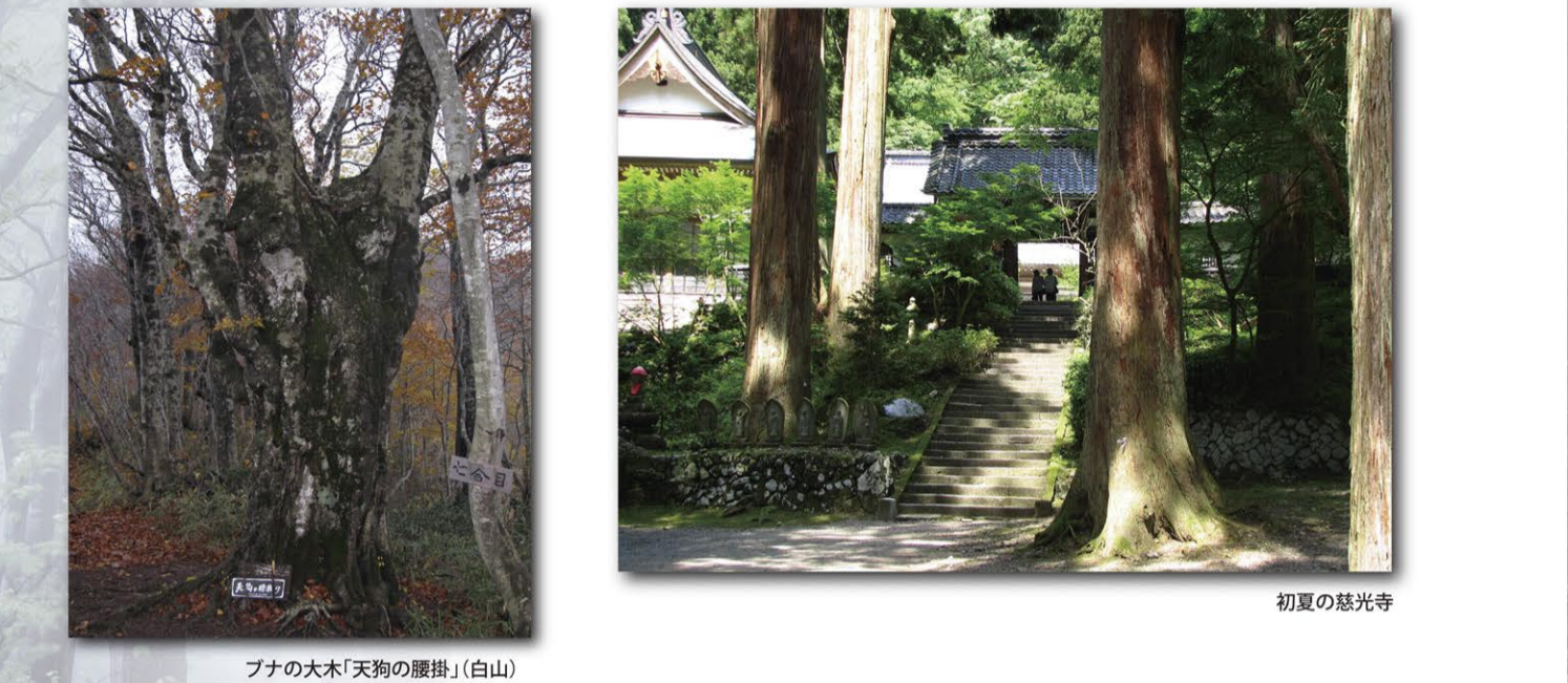
フナの大木「天狗の腰掛」(白山)