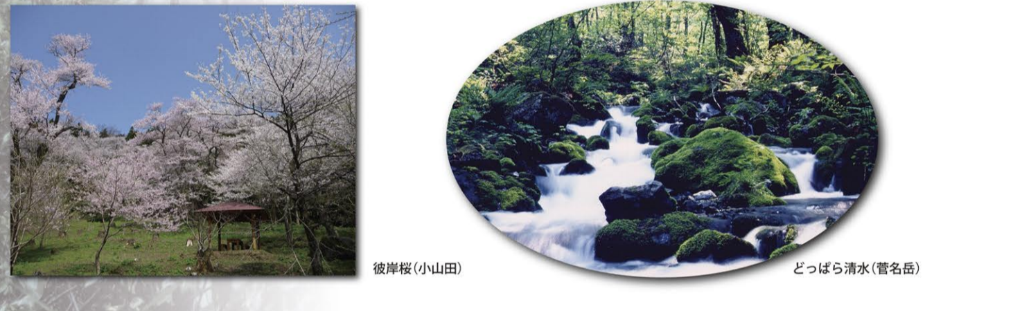
どっばら清水(菅名岳)